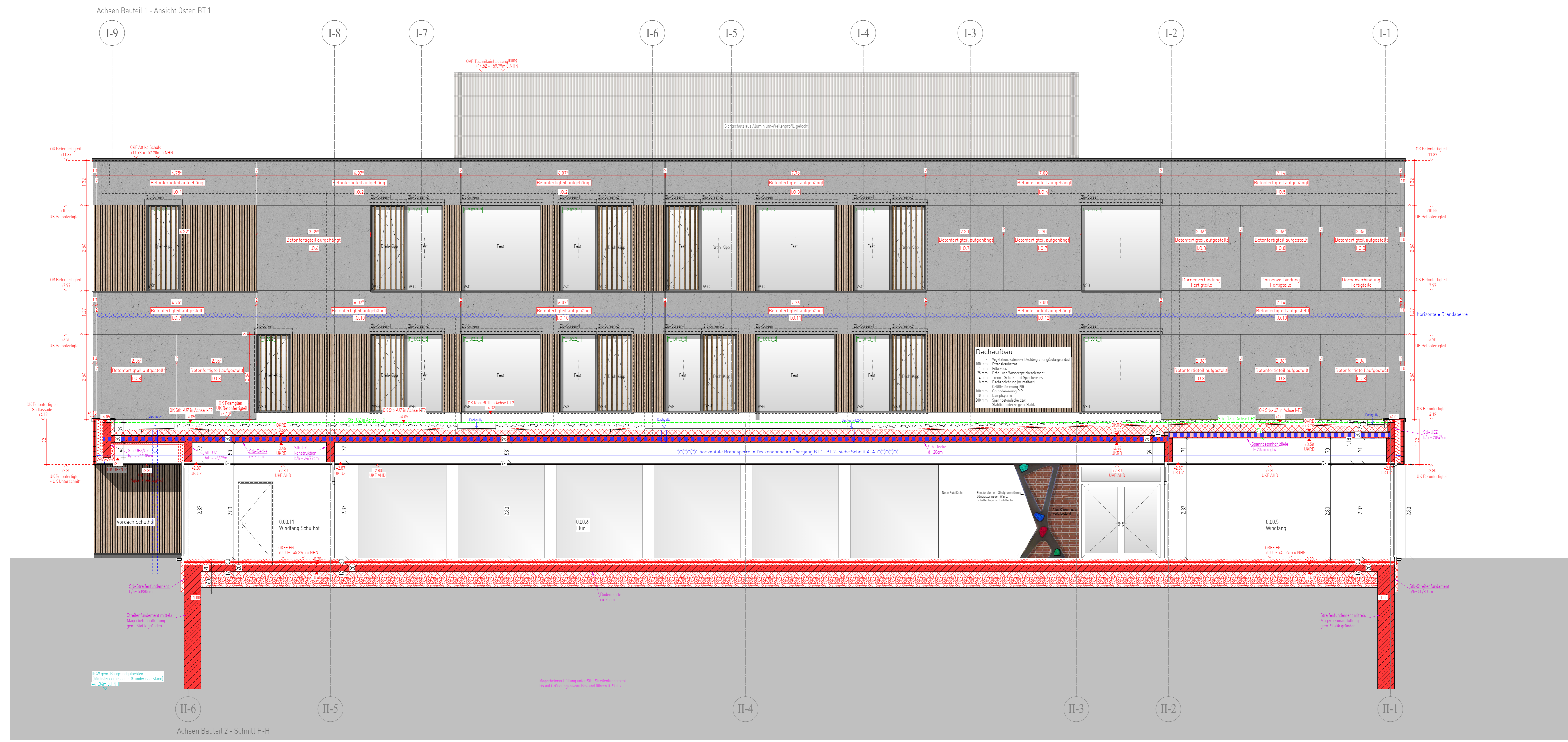
BT I Ansicht Ost = Schnitt H-H