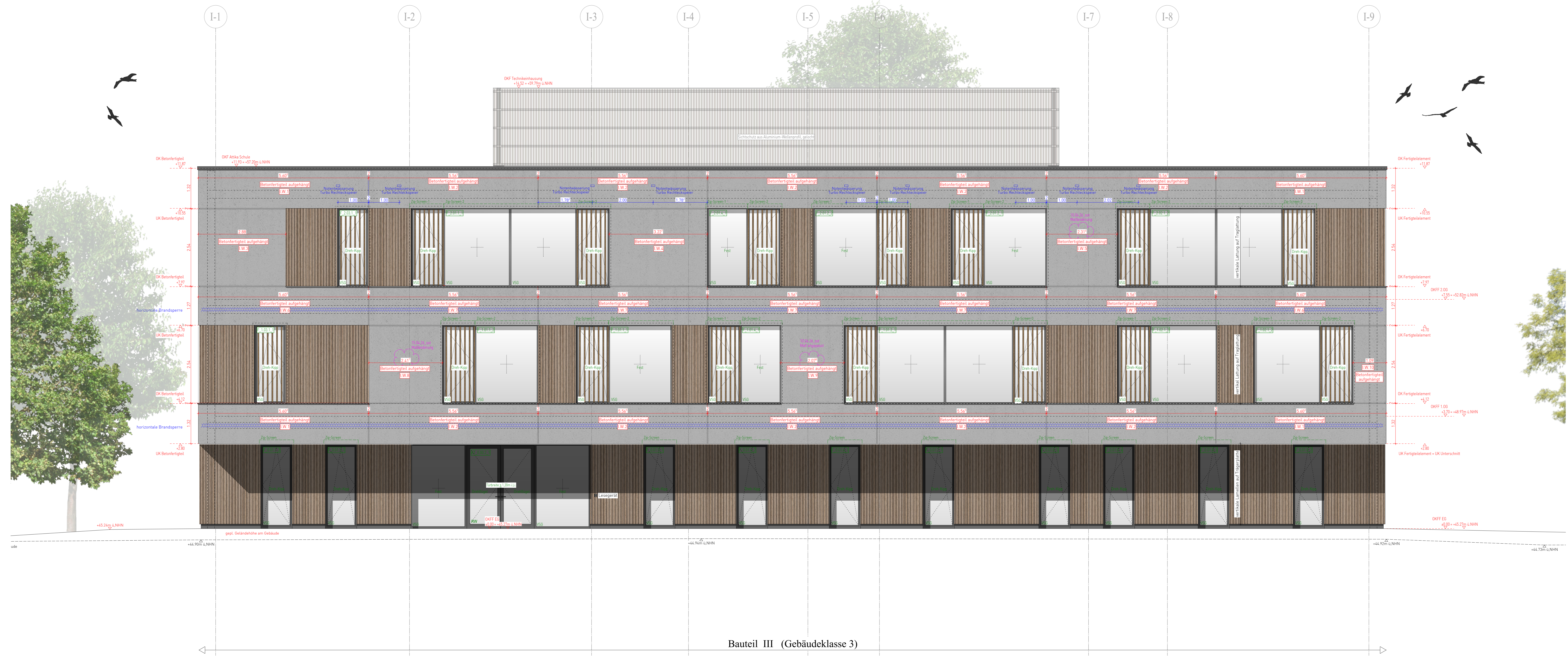
BT I Ansicht West