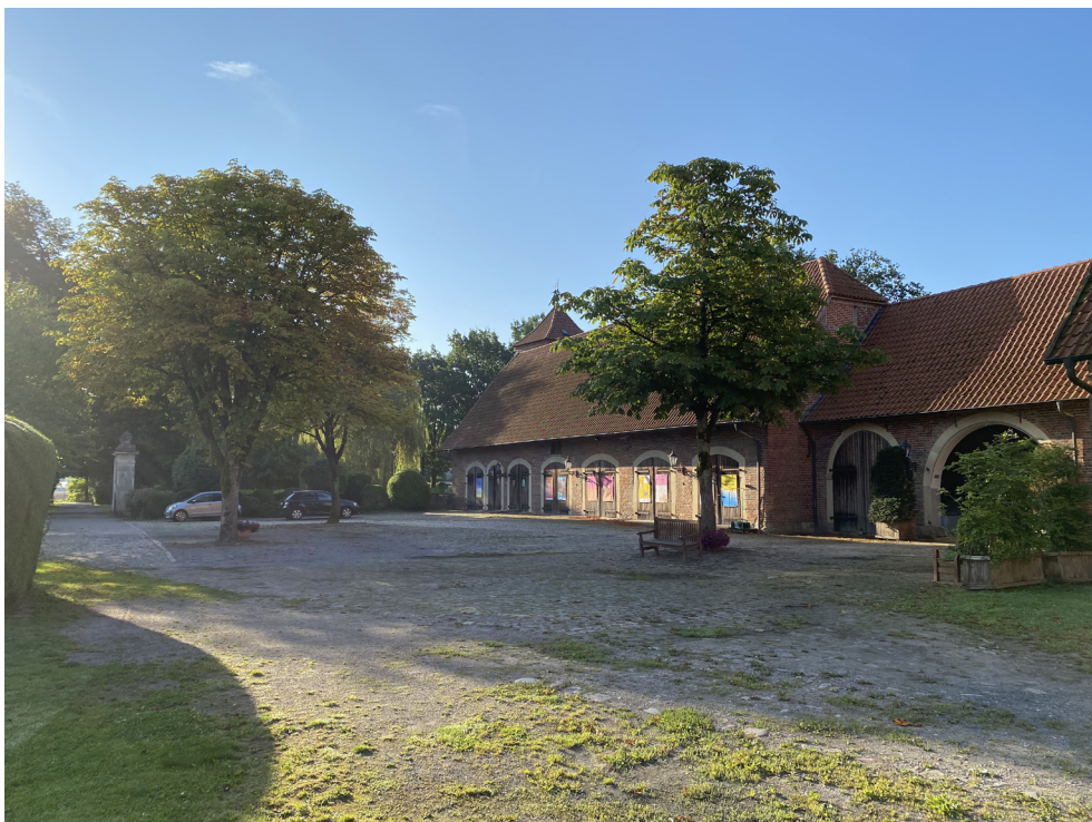
Vorburg - Scheune und Innenhof - Nordansicht