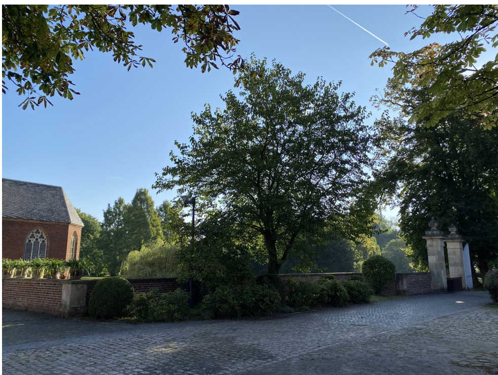
Vorburg - Innenhof - Bestandsbeet