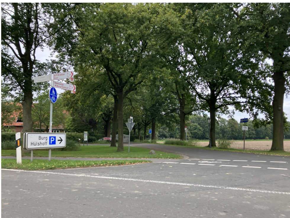
Einfahrt - Richtung Havixbeck