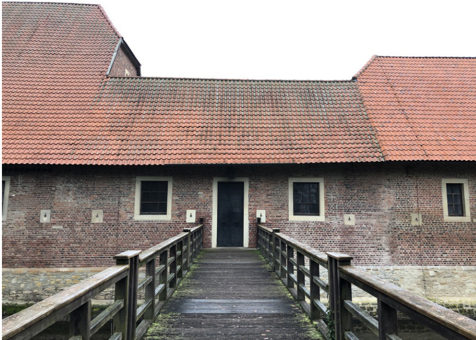
Torhaus und Brücke - Südansicht