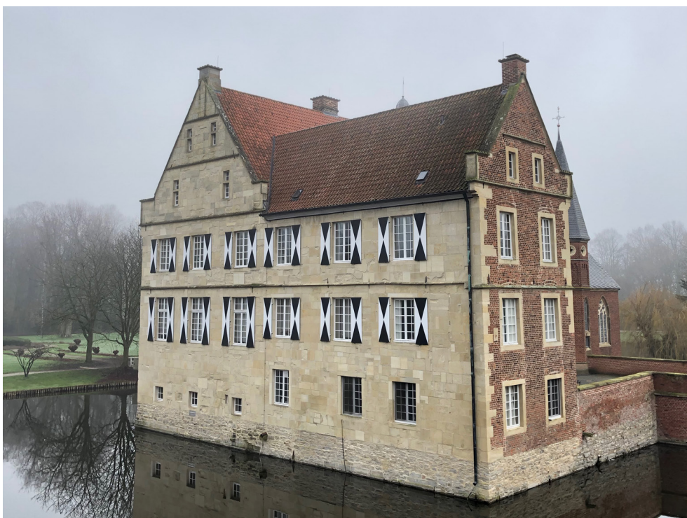
Haupthaus - Westansicht