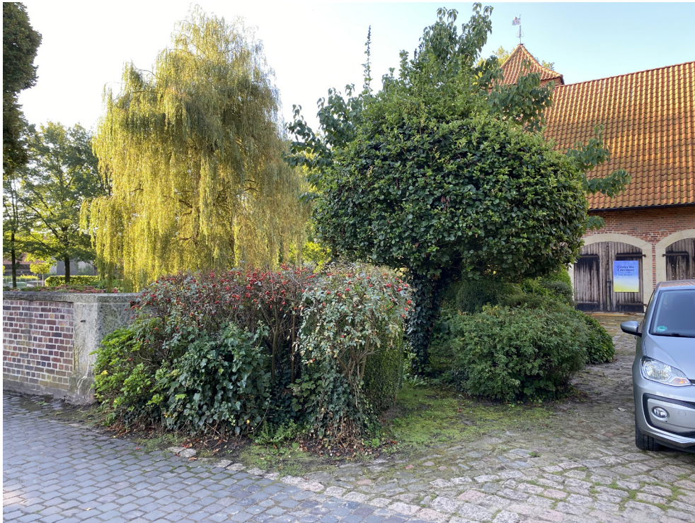
Vorburg - Innenhof - Bestandsbeet