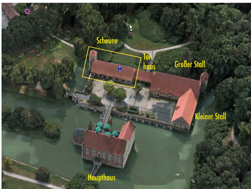
Vogelperspektive - Apple Karten 09.09.24