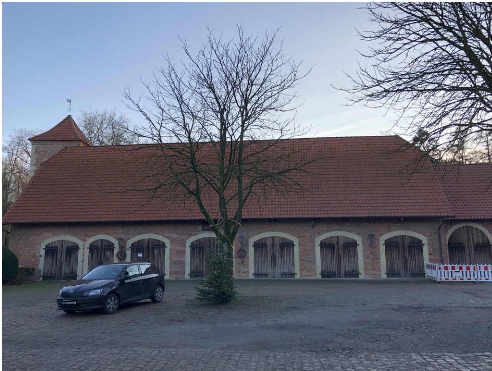
Vorburg - Scheune und Innenhof - Nordansicht