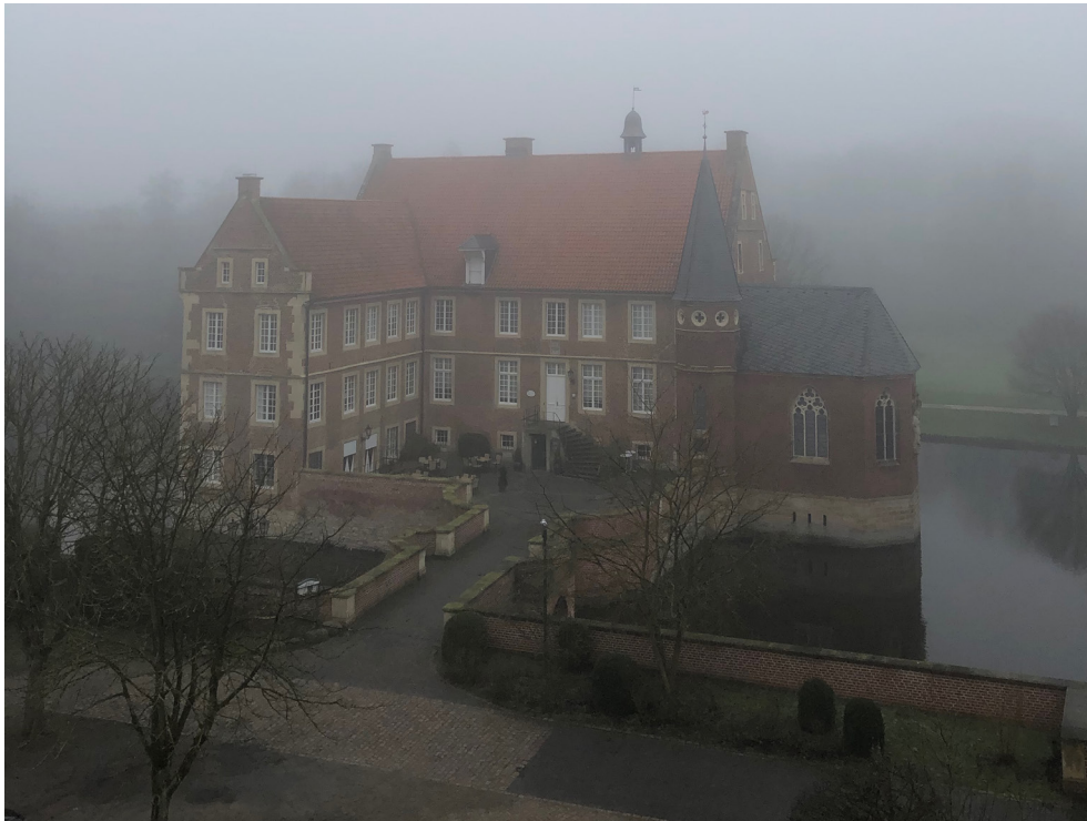
Haupthaus - Südansicht