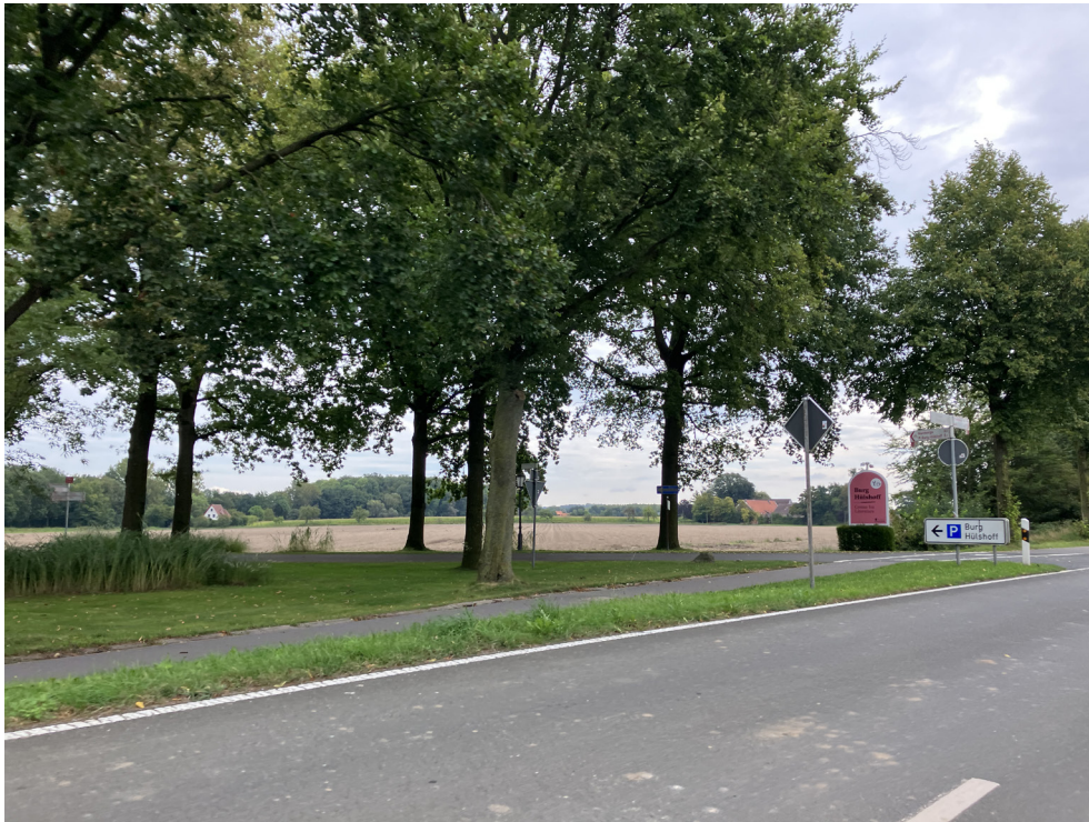
Einfahrt - Richtung Münster Zentrum