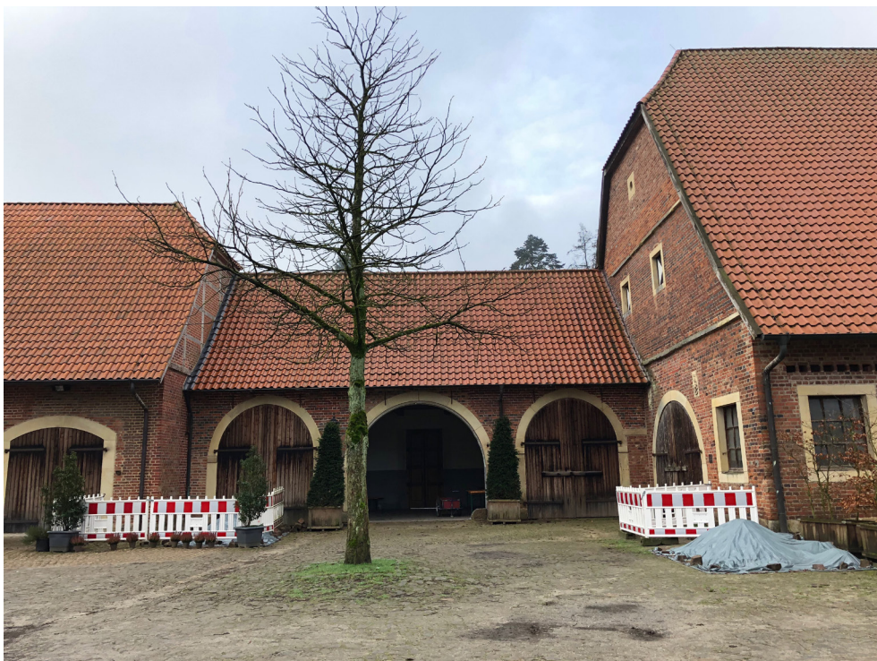
Torhaus - Nordansicht