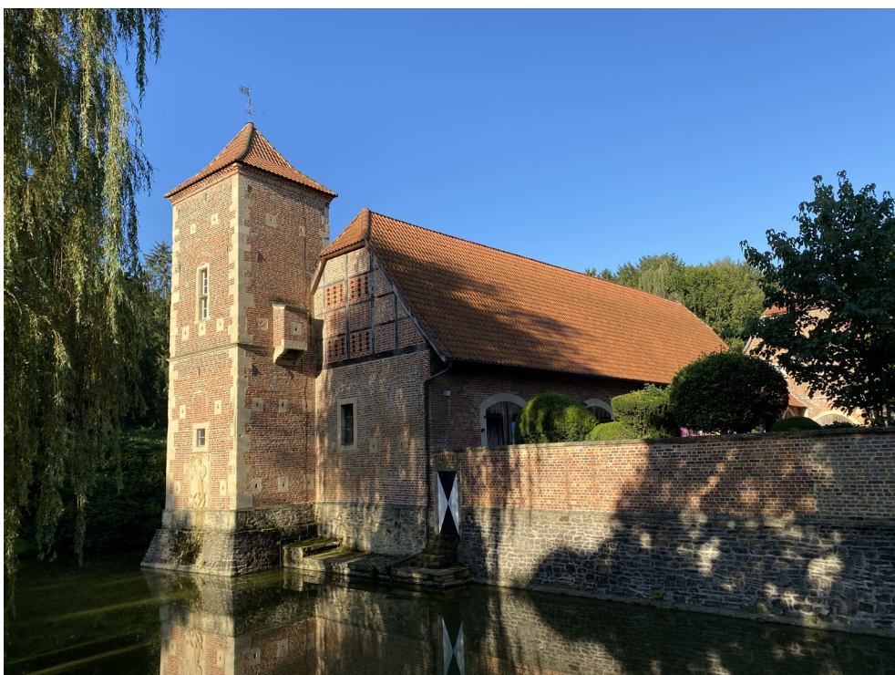
Vorburg - Scheune - Ostgiebel