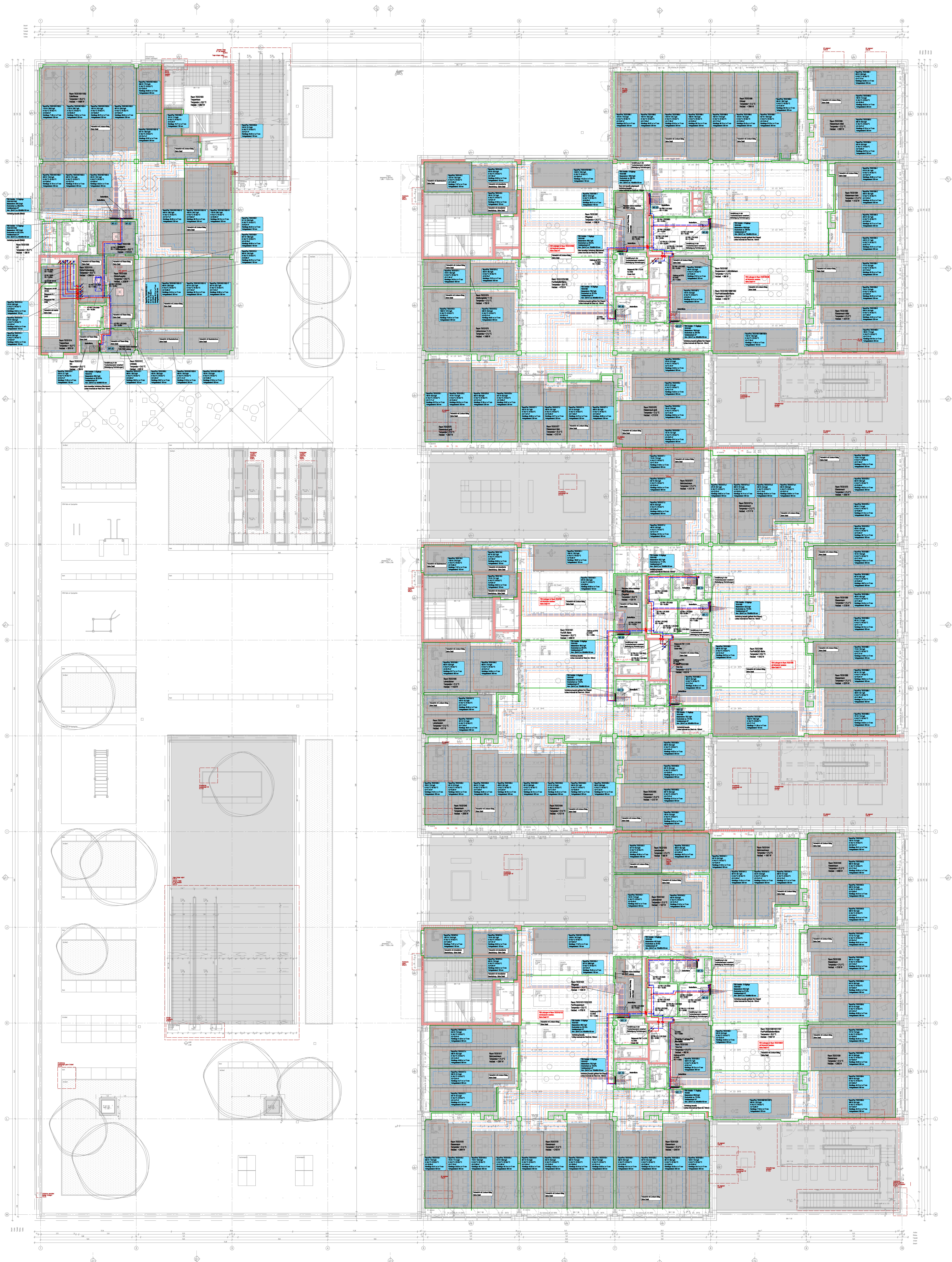
Detail: Verlegung der Heizkreise